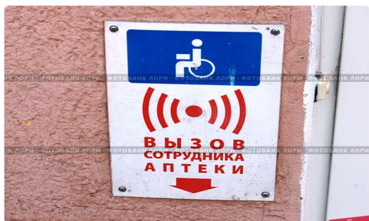
Табличка для инвалидов "Вызов сотрудника аптеки"

При отсутствии доступного входа в социально-значимое учреждение, на здании устанавливается кнопка вызова специалиста.