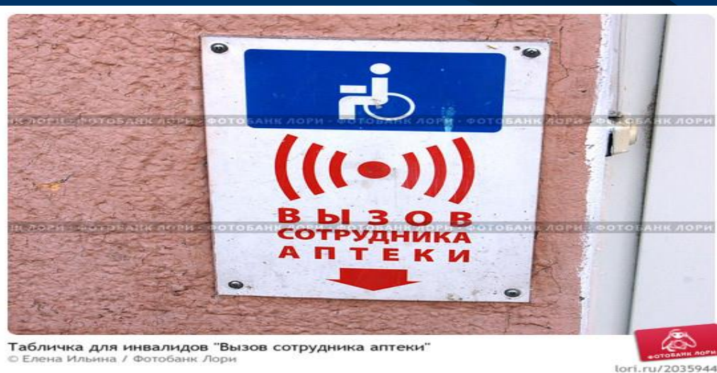
Табличка для инвалидов "Вызов сотрудника аптеки"

При отсутствии доступного входа в социально-значимое учреждение, на здании устанавливается кнопка вызова специалиста.